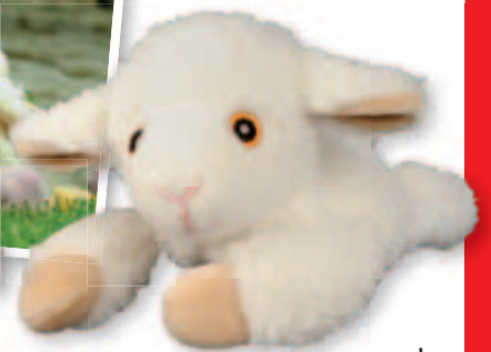
11 b |