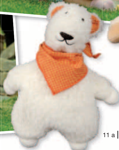
11 a |