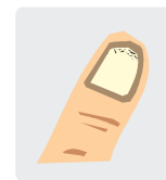
Brüchige Nägel mit Abschuppung

Die Veränderungen der Nägel werden oft durch Erkrankungen hervorgerufen. Dazu gehören z.B. die Schuppenflechte (Psoriasis), die Zuckerkrankheit (Diabetes) oder Pilzinfektionen (Onychomykose). Letztere sind der Auslöser für mehr als 50% der Nagelveränderungen.