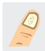
Tüpfel / Grübchen