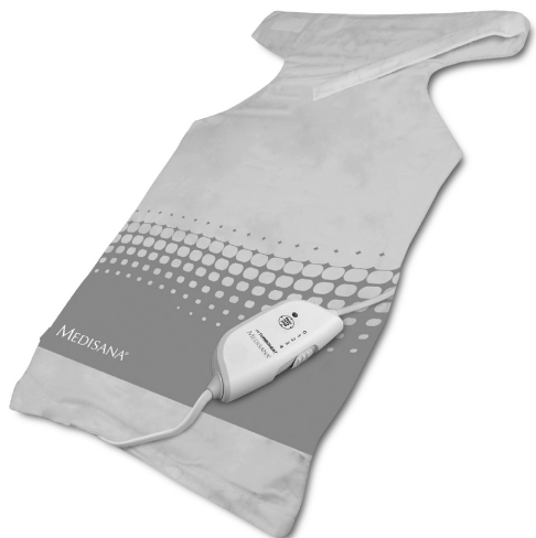
HP 610 Art. 61167