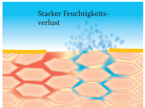
Lipidverlust führt zu einer gestörten Hautbarriere: Die Haut verliert viel Wasser und trocknet aus.

Gleichgültig ob eine innerliche oder äußerliche Ursache vorliegt, die Folge ist immer gleich – eine trockene, schuppige und spröde Haut, die verstärkt zu Entzündungen, Juckreiz und Ekzemen neigt.