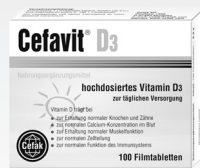
Hochdosiertes Vitamin D3

*: Cefamagar® Tabletten - Wirkstoff: Fucus vesiculosus trit. D2. Anwendungsgebiet: Das Anwendungsgebiet entspr. dem homöopathischen Arzneimittelbild: Dazu gehört: Übergewicht. Hinweis: Eine krankheitsbedingte Ursache der Fettsucht ist vor der Einnahme des Arzneimittels abzuklären. Eine Abklärung durch den Arzt ist gleichfalls bei Kropfleiden erforderlich. Bei anhaltenden Beschwerden ist eine Rücksprache mit dem Arzt notwendig. Warnhinweis: Enthält Lactose. Zu Risiken und Nebenwirkungen lesen Sie die Packungsbeilage und fragen Sie Ihren Arzt oder Apotheker.