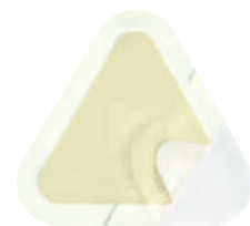
Askina® Transorbent® Sacrum